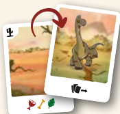
Entorno seguro / Efecto Mariposa